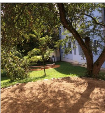
Natürliche Beschattung im Kindergarten Empersdorf © DI (FH) Isabella Kolb-Stögerer

Hintergrund: Durch die sommerliche Hitzebelastung ist die Einhaltung der Hygienestandards besonders wichtig, um wirtschaftliche Verluste (Entsorgung von verdorbenen Lebensmitteln) sowie gesundheitliche Folgen durch den Konsum von nicht mehr einwandfreien Lebensmitteln, zu vermeiden.