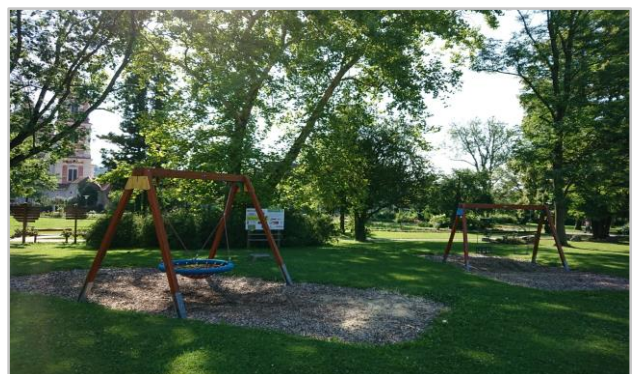
Natürliche Beschattung – Spielplatz Pöllau

Hintergrund: Einsatz und Züchtung von Sorten, welche wechselnde klimatische Bedingungen, wie zunehmende Trockenheit, tolerieren.