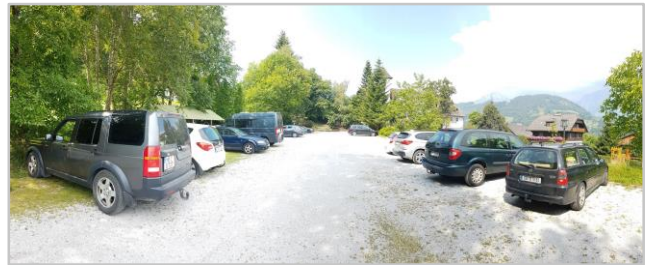
Schotterrasenparkplatz Schlosshotel Thannegg