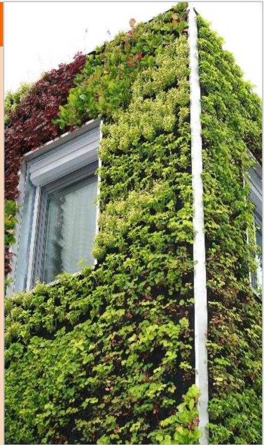
Fassadenbegrünung Rathaus Weiz