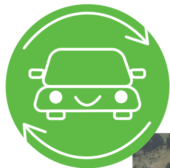
SCHLOSSZWINGER Peugeot HF-738 DD