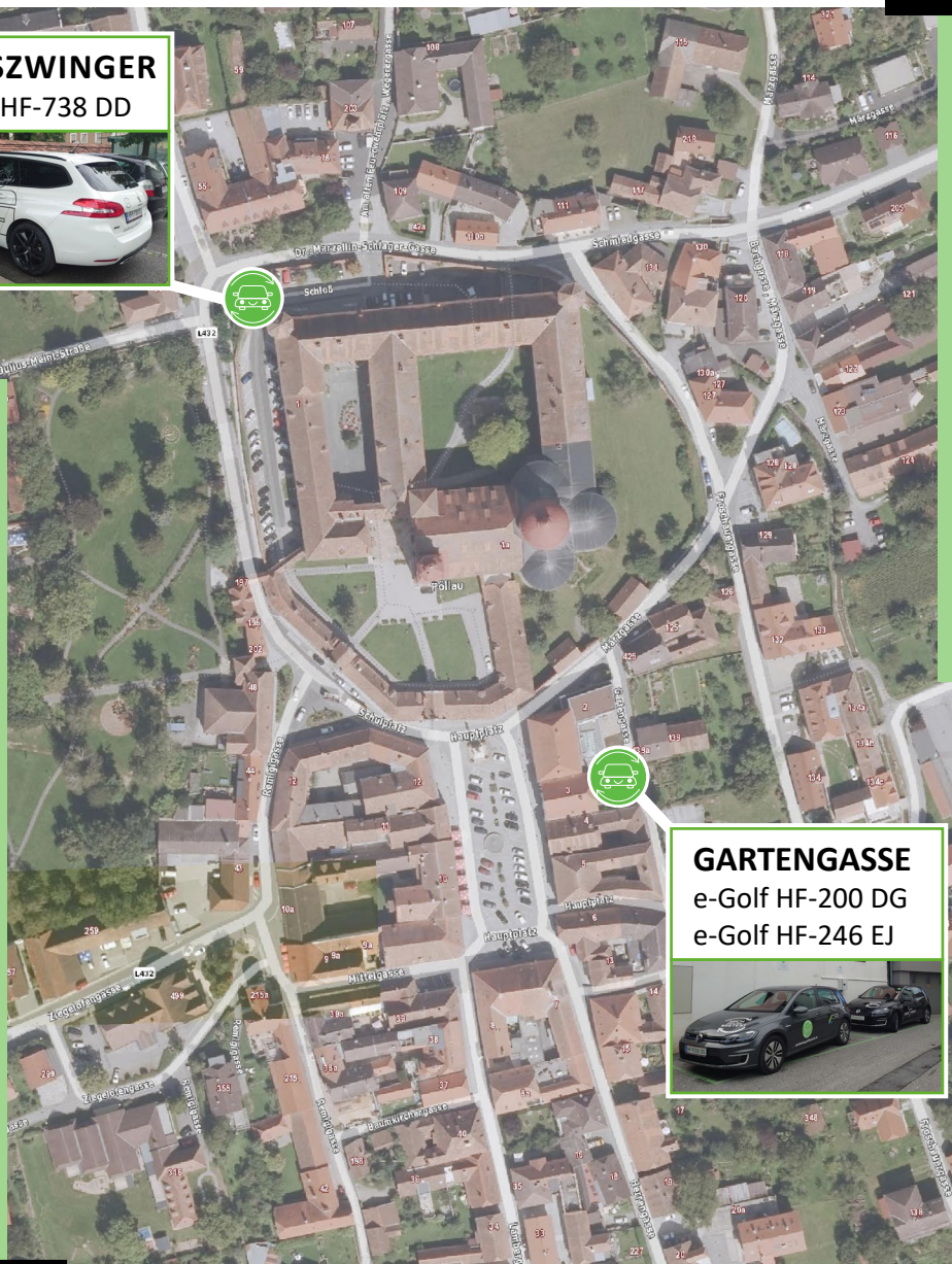
GARTENGASSE e-Golf HF-200 DG e-Golf HF-246 EJ